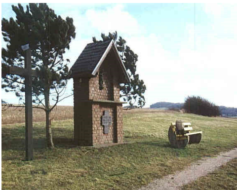
vor Mahlberg mit Michelsberg

In der Ortsmitte, wo die L 165 Bad Münstereifel - Schuld einen Knick macht, gehen wir die Mahlberger Straße in Serpentinaugen bergan. Ein kurzes Stück nach der letzten Serpentine nehmen wir rechts im spitzen Winkel zurück einen Feldweg aufwärts zum Waldrand. Dort gehen wir links und kommen auf der Höhe an einen Bildstock. Von hier weiter Rundblick.