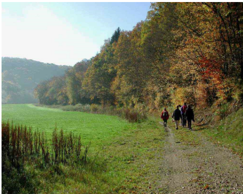
Nohner Bach Tal

Wanderzettel 38 W33 2001 Hocheifel Müsch