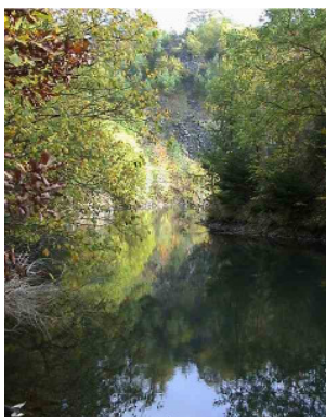
See in der Düngerlei

Am Rande eines Ackers nach links in den Wald nur noch leicht bergan bis zur Straße. Nun ca. 500 m Straße, erst kurz links, am Straßendreieck rechts, am Parkplatz vorbei und den nächsten Weg rechts. Vor der Wegsperre rechts bis zu einem Rastplatz. Kurz danach links über Wiesen zur Düngerlei. Auf dem Asphaltweg nach rechts ca. 1 km bis zur Fachwerkhalle am Aussichtspunkt Burgkopf. Schöner Blick auf den See.