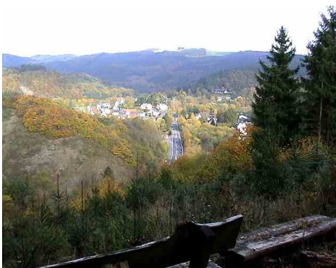
Ahrtal bei Müsch

Wenig später im Wald links steil bergab (Weg 3) bis zu einem Querweg, diesen am Hang rechts. Von diesem Fahrweg geht kurz bevor er die freien Pläne erreicht, nach links ein Trampelpfad leicht abwärts, diesem folgen bis zu einem weiteren Fahrweg, auf diesem links abwärts. Nach ca. 1 km am Hang im Niederwald treffen wir auf den alten Ahruferweg (A), geradeaus weiter auf diesem Weg. Wir erreichen einen Aussichtspunkt mit Blick ins Ahrtal nach Müsch.