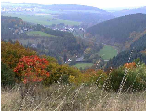
Ahrtal von Düngerlei

Von Parkplatz aus wandern wir über die Ahrbrücke, überqueren die B 258 und gehen halblinks die Straße Richtung Hoffeld bergan. Nach dem Friedhof die Straße in einer Serpentine weiter aufwärts bis zu einem im spitzen Winkel abgehenden Weg (etwas zugewachsen). Diesem folgen wir weiter aufwärts (später Hohlweg). Wir überqueren einen Waldweg und gehen am Waldrand entlang geradeaus.