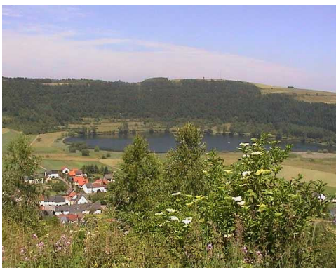
Meerfelder Maar vom Maarblick

Dort weiter auf dem Weg EV-Weg bergan, zunächst Asphaltweg und ca. 100 m nach dem Jagdhaus an einer Bank links im Wald Pfad weiter aufwärts bis zu einem Fahrweg. Dort links/rechts bergan zum Landesblick mit fantastischem Rundumblick. Kurz danach verlassen wir den EV-Weg nach rechts (Blick zum Mosenberg) und richten uns abwärts in das kleine Tal. Auf Fahrspuren geht es durch Wiesen und Felder hinab zu der auf halber Höhe liegenden Feldscheune. Davor links abwärts einen Wiesenweg (Sauerseifen), der uns ins Kleine Kylltal hinabführt.