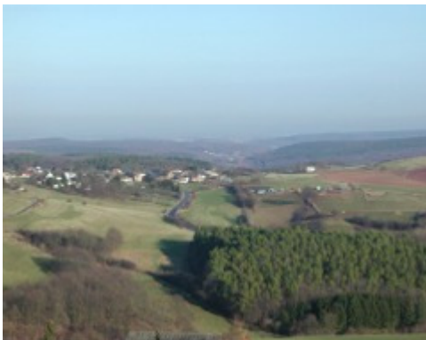
Mechernich-Bergheim mit Veytal

Nun auf dem Asphaltweg nach links und abwärts. Am Waldrand entlang bis zu einem Feldweg. Nun rechts ab und zwischen Kiefernwald und Weide leicht bergan zum Sportplatz. An der Hütte weite Sicht Richtung Zülpich und Düren. Wieder zum Weg zurück und links abwärts bis zum Waldrand. Auf dem Asphaltweg dann rechts nach Lorbach.