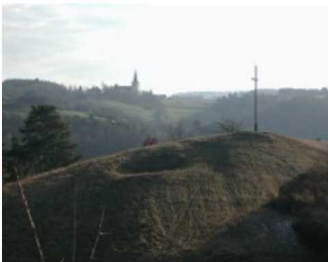
Eulenberg, dahinter Weyer

Am Ende des Weges links hinab zu einem Asphaltweg. Hier links nach Lorbach. Am Ortsanfang nach rechts (Michael Schumacher Straße) und durch eine hügelige Wiesenlandschaft, in den Alpen würde man Alm dazu sagen. Später senkt sich der Weg Richtung Vollem. An einer Wegegabel mit Bank obh. Vollem nach rechts auf dem Römerkanal-Wanderweg weiter.