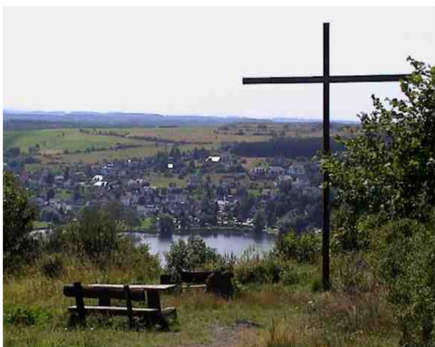
Maarkreuz und Schalkenmehrener Maar