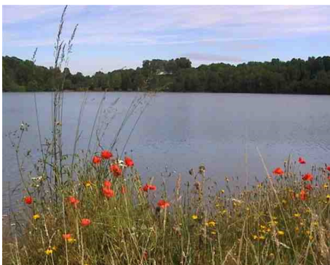
Weinfelder Maar (Totenmaar)

Im Ort gehen wir auf der Mehrener Straße an der Kirche vorbei und biegen den zweiten Weg links ab (Weg 3). Er verläuft auf halber Höhe mit schönem Blick auf das Maar und das anschließende trockene Maar.