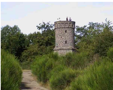
Dronketurm auf dem Mäuseberg

Vom Parkplatz wandern wir am Waldcafe vorbei Richtung Dronketurm . Hinter der Schranke den Weg links bergan (EV-Weg 2). Er führt stetig aufwärts durch Wald. Wo der Wald aufhört, stehen wir auf dem Plateau des Mäusebergs und unmittelbar am Dronketurm mit seiner tollen Rundumsicht. Tief unten das Gemündener Maar, im Süden die Sternwarte auf dem Hohen List. Am östlichen Ende des Plateaus erster Blick auf das Weinfelder Maar. Hier links bergab.